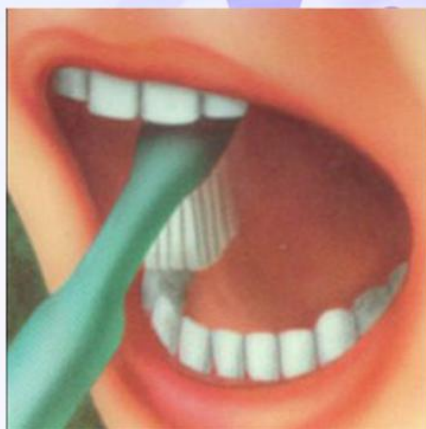
4. Жевательные поверхности зубов