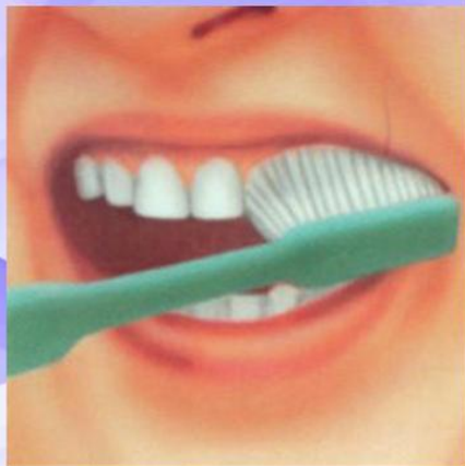
1. Наружные поверхности зубов