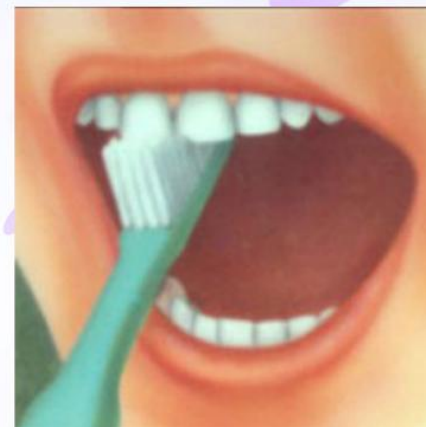
3. Внутренние поверхности передних зубов