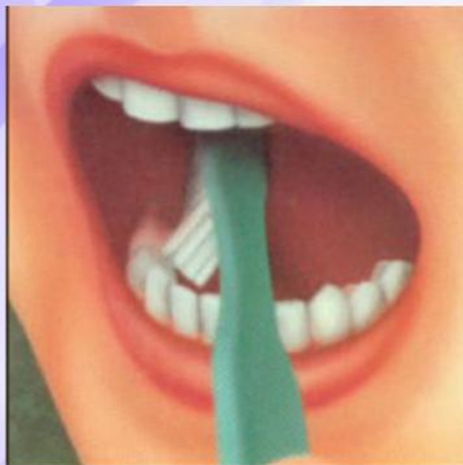
2. Внутренние поверхности зубов